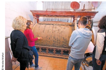
F - Cylindre du carillon