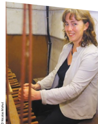
A - Entresol du clavier

Les cloches du nouveau carillon sont bénites le 13 novembre 1867 en présence de 100 parrains et marraines choisis pour que leurs âges correspondent au poids de la cloche portant leurs noms ! L'instrument fonctionne sans difficulté pendant soixante ans, rythmant la vie des habitants de ses mélodies quotidiennes.