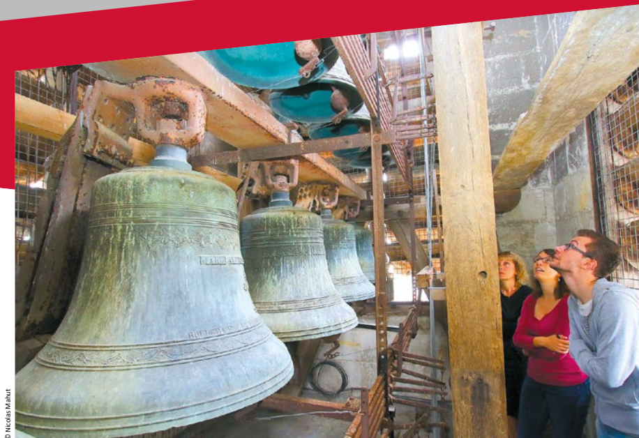
E - Les cloches de la tour nord sont visibles lors de visites