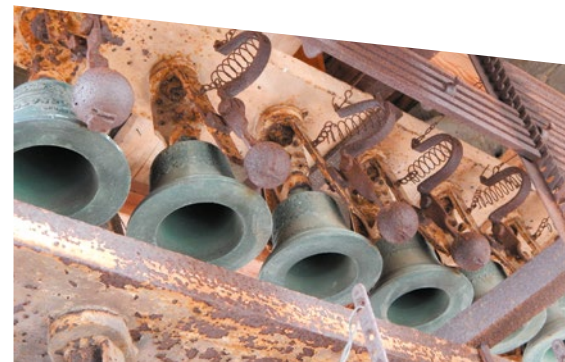
B - Les plus petites cloches de la tour nord