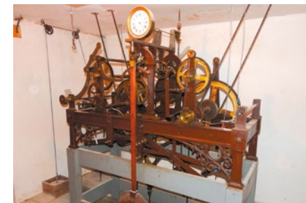
G - Mécanisme de l'horloge