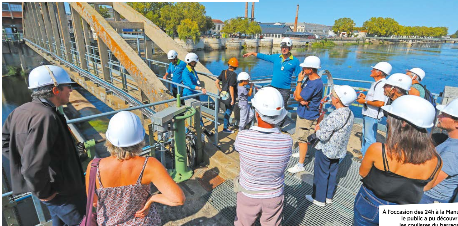
À l'occasion des 24h à la Manu, le public a pu découvrir les coulisses du barrage.

L'eau est une ressource précieuse. Cette source d'énergie renouvelable est exploitée au barrage de Châtellerault, ouvrage d'art qui achève sa modernisation. Revers de la médaille, l'eau peut également représenter un risque pour lequel l'anticipation et la prévention sont de mise.